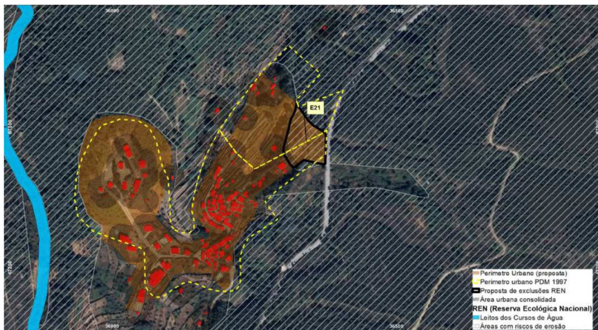
Figura 1 - Identificação da área excluída da REN - manchas E20 e E21