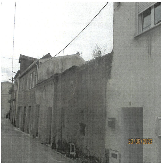
Foto do Local

“Sempre que se constate a existência de árvores, arbustos ou qualquer tipo de vegetação, ainda que localizada em propriedade privada que ponha em causa o interesse público municipal ou particulares por motivos de higiene, limpeza, saúde, segurança, risco de incêndio ou comprometer infraestruturas, poderá o Presidente da Câmara ou o Vereador no uso de competência delegadas, notificar o proprietário, para proceder ao abate, limpeza, desgaste, poda ou tratamento daqueles no prazo determinado.”