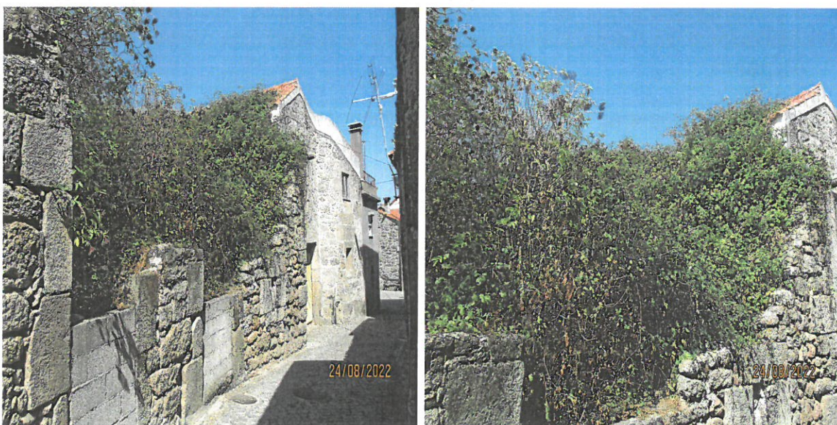
Foto do Local

“Sempre que se constate a existência de árvores, arbustos ou qualquer tipo de vegetação, ainda que localizada em propriedade privada que ponha em causa o interesse público municipal ou particulares por motivos de higiene, limpeza, saúde, segurança, risco de incêndio ou comprometer infraestruturas, poderá o Presidente da Câmara ou o Vereador no uso de competência delegadas, notificar o proprietário, para proceder ao abate, limpeza, desgaste, poda ou tratamento daqueles no prazo determinado.”