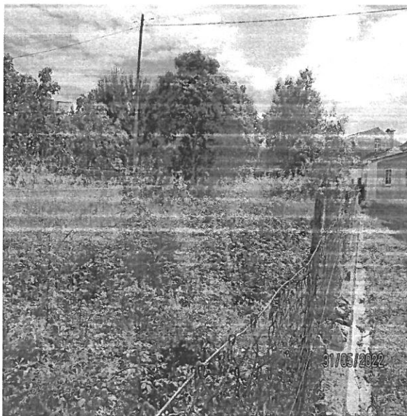
Foto do Local

“Sempre que se constate a existência de árvores, arbustos ou qualquer tipo de vegetação, ainda que localizada em propriedade privada que ponha em causa o interesse público municipal ou particulares por motivos de higiene, limpeza, saúde, segurança, risco de incêndio ou comprometer infraestruturas, poderá o Presidente da Câmara ou o Vereador no uso de competência delegadas, notificar o proprietário, para proceder ao abate, limpeza, desgaste, poda ou tratamento daqueles no prazo determinado.”